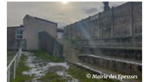
La modification du bâti existant sera l'occasion de revoir l'accès entre les deux terrains de football

Le montant total des travaux est estimé à 3 982 373 € HT (valeur décembre 2022) et comprend :