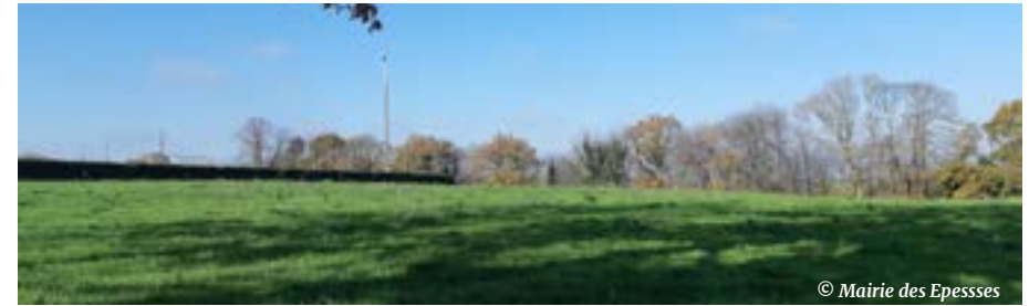
La nouvelle salle polyvalente sera construite dans le champ jouxtant le terrain de foot d'entraînement