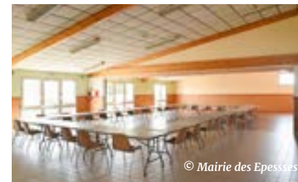
Les salles 1 et 2 actuelles seront démolies et l'espace libéré sera intégré aux parkings