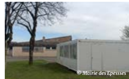
Le modulaire club-house sera supprimé, une salle dédiée sera intégrée dans le projet de restructuration