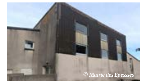
L'ancienne salle de gymnastique (salle 3) sera adaptée pour l'exercice de la danse