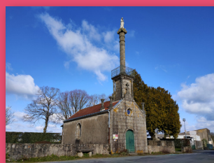
La chapelle de la Colonne

5. L'emprunter à droite sur 50m, puis accéder à gauche à la rue Collineau pour rejoindre la rue Colbert , prendre à droite sur 100m, à nouveau à droite descendre la petite venelle rue Courbet , puis la rue du Pavé et à gauche la rue du Puit . A la poste , remonter à gauche la rue de la Libération , accéder au stade par la rue de La Colonne , passer entre la salle des sports et le terrain de foot, prendre à droite puis à gauche pour rejoindre la Breteche .